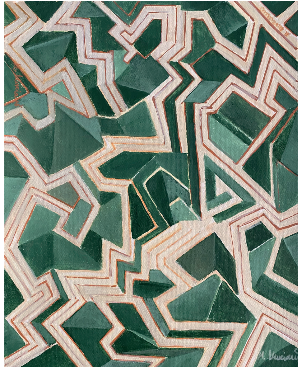
LABERINTO I · acrílico sobre papel, 30 x 21 cms., 2022