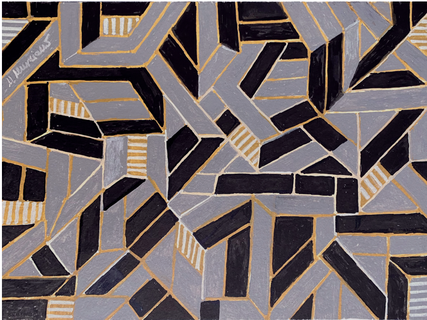
ESCALERAS · acrílico sobre papel, 21 x 30 cms., 2021 GRIS Y NEGRO · acrílico sobre papel, 21 x 39 cms., 2019