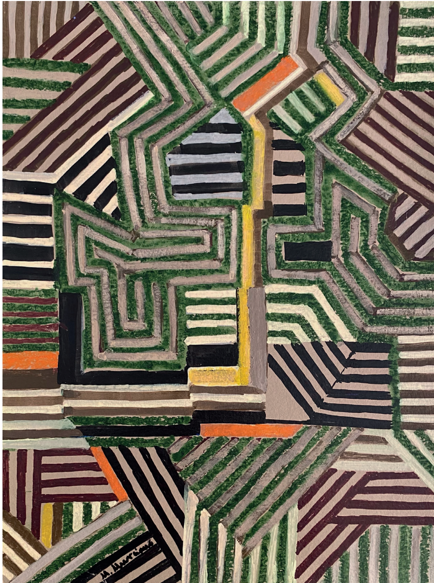
CAMINO AMARILLO · acrílico sobre papel, 30 x 21 cms., 2019

(Obra pliego anterior) SIN TÍTULO · acrílico sobre papel, 50 x 70 cms., 2019